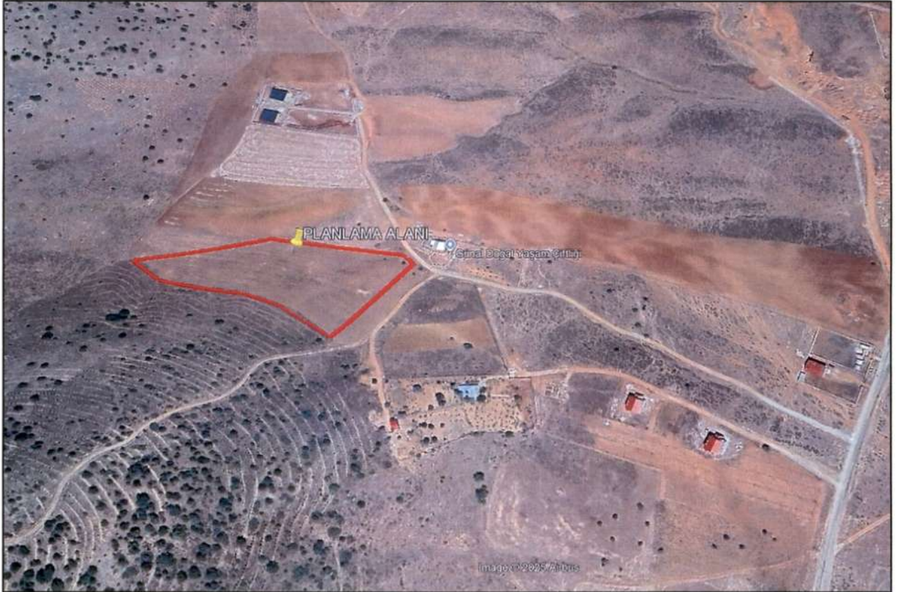
Şekil 1. İmar Planına Konu Olan Alana Ait Uydu Görüntüsü

Planlama alanı; Göksun ilçesi, Ortatepe mahallesi sınırları içerisinde L37-D-16-D paftası, 206 ada 2 parsel üzerinde yer almaktadır.